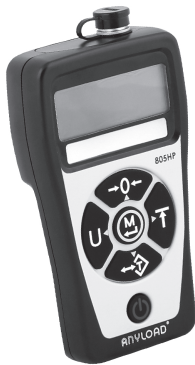
称重显示器键板图